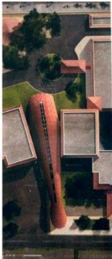
Propuesta ganadora edificio TIC