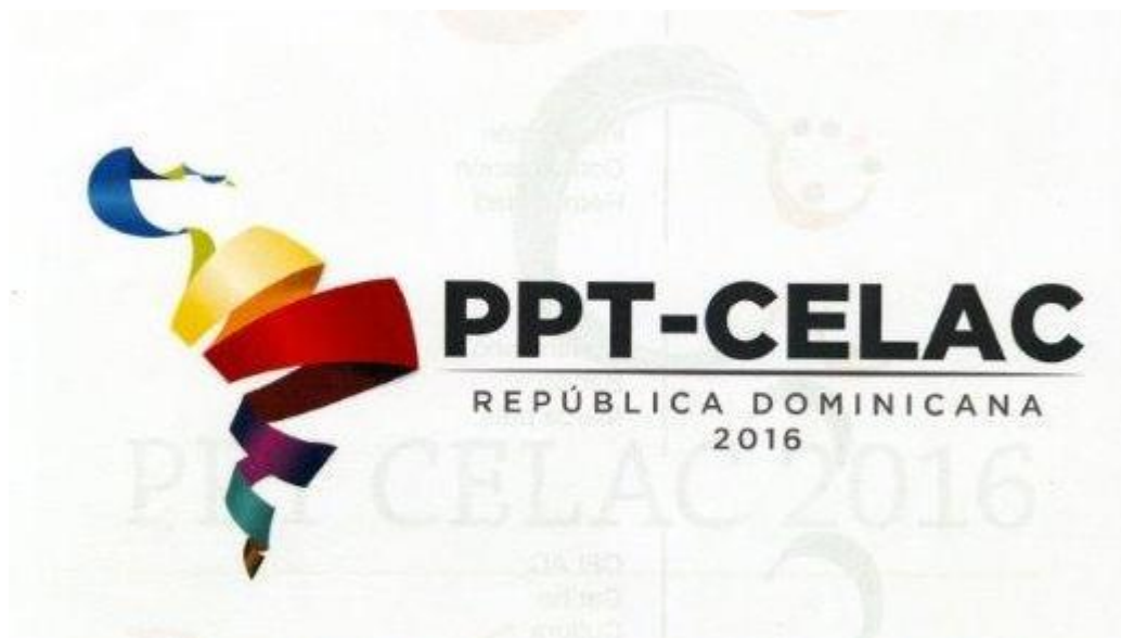
Propuesta ganadora logotipo

Se celebró el Concurso de Ideas del Logotipo e Identidad Visual de la Presidencia Pro Témproe 2016 de la Comunidad de Estados Latinoamericanos y Caribeños (CELAC), organizado por el Ministerio de Relaciones Exteriores (MIREX), en el que participaron 5 escuelas de diseño gráfico universidades de todo el país.